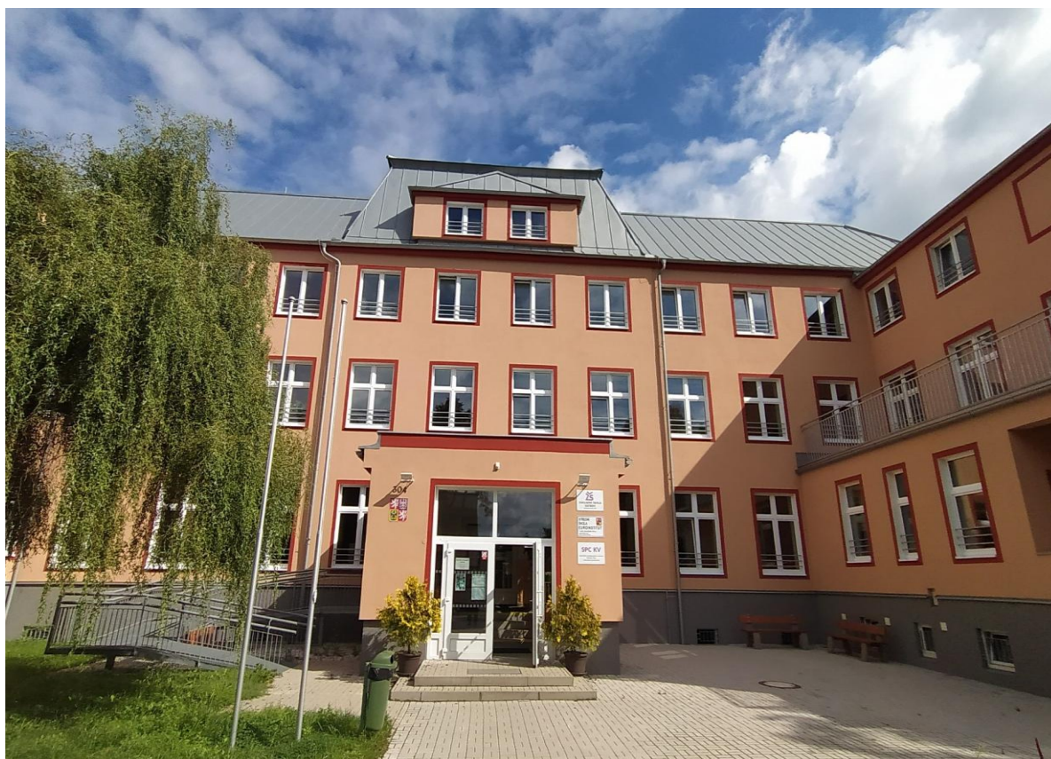
Budova školy po rekonstrukci

V závěru školního roku jsme se dočkali dokončení rekonstrukce školy. Budova školy je zateplená, má novou fasádu a nová plastová okna.