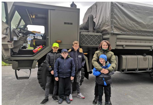
Ukázka vojenské techniky v naší škole