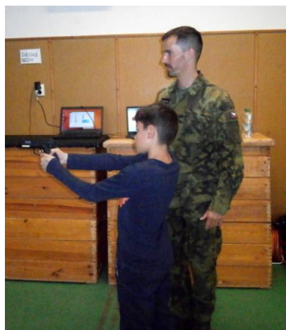
Zkouška střelena trenažéru