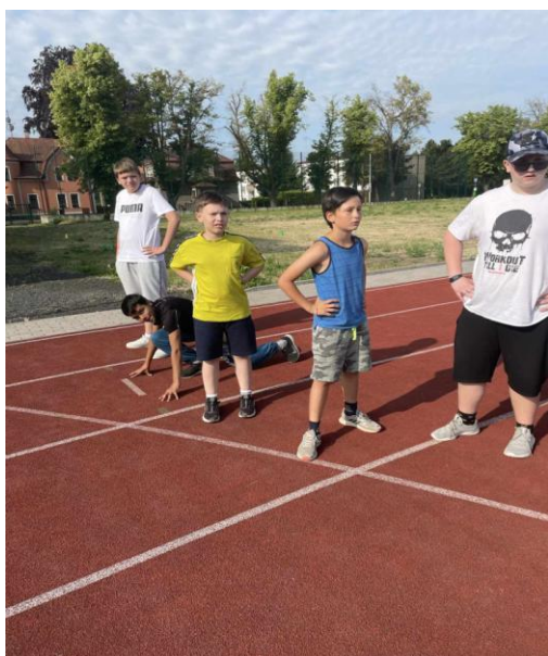
Sazka olympijský běh