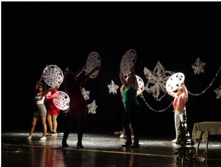
Vánoční akademie v Domě kultury Ostrov

Celá škola se zúčastnila nácvičku na vánoční akademii, která se letos mimořádně vydařila. Publikum z řad rodičů, prarodičů a přátel školy zaplnilo sál Domu kultury v Ostrově a vidělo moc hezká vystoupení žáků i pedagogů.