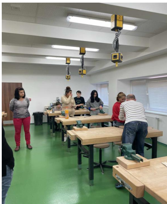
V dílně v ZŠ Májová Ostrov

V rámci zapojení školy do projektu MAS proběhly vyučovací hodiny na ZŠ Masarykova, kde byly připraveny hodiny chemie a přírodopisu a na Základní škola Májová, kde si naši žáci vyzkoušeli práci se dřevem v nové pracovní dílně