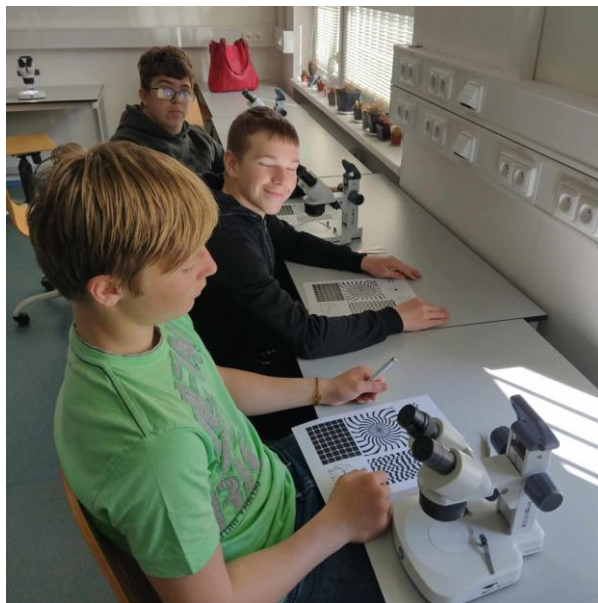
V laboratoři na Gymnáziu Ostrov

Žáci pravidelně navštěvovali s vyučujícími 3D učebnu na Gymnáziu, kde měli možnost pod mikroskopem pozorovat různé zajímavé preparáty. Zajímavá a přínosná byla i návštěva Planetária v Chebu.