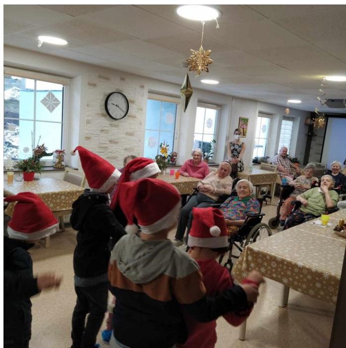
III. B v Domově pro seniory „Květinka“

Třída III. A p. učitelky Kopecké potěšila seniory při vánočním vystoupení a v Domově pro seniory „Květince“